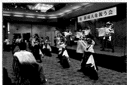
アトラクション (よさこい)