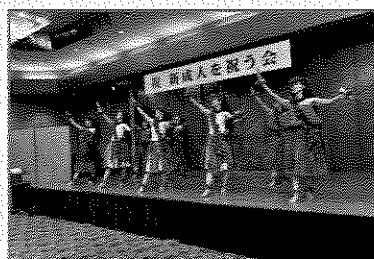
アトラクション (フラダンス)