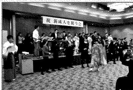
アトラクション (バンド)