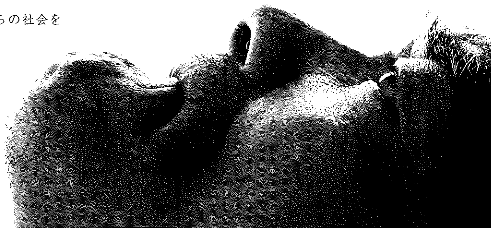
遠藤 滋 (映画『えんとこの歌』より)