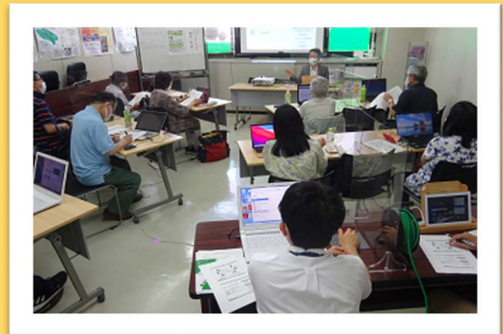
主催のための会議設定から説明してもらいました

満員御礼の本講座。会議を主催するホストになると、使える機能が倍増します。そのためには、ややこしい設定をしなければ(~_~;)。さて、参加者の感想は「まだスタート地点なので、少しずつ…」「まず、自分がどの位、使いこなせるか」「難しかったが良い内容なのでもっと教えていただきたい」と回答があり、第2弾の検討が必要かも…?