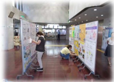
あじさい会館(2018年度)