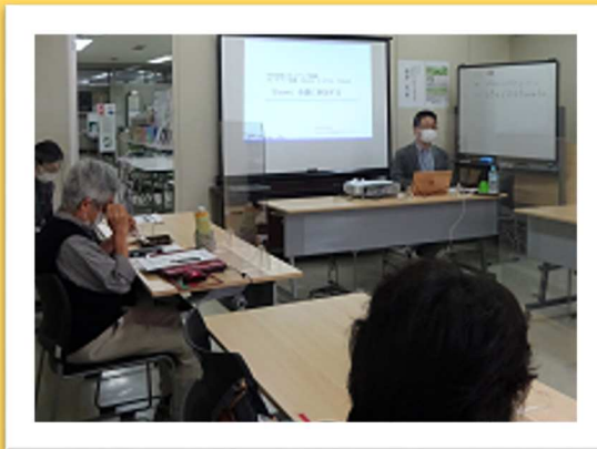
はじめてのオンライン会議はドキ