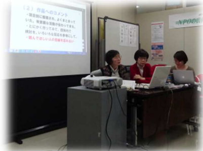
講師によるレクチャー(2018年度)