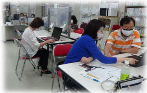
「あ〜でもない、こ〜でもない」スタッフ同士で学び合い

さぼせんナウ90号に報告した通り、初めてのオンライン開催だった利用者懇談会。その反省をもとに、3月からスタッフ間でオンライン会議システムZoom®についてを学び合いながら研修実施しています。4月はグループワーク開催方法、5月には画面共有方法や投票機能の勉強会。アンケートからもその様子を察することができるかも。さてさて、オトナなスタッフたちの成長やいかに！？