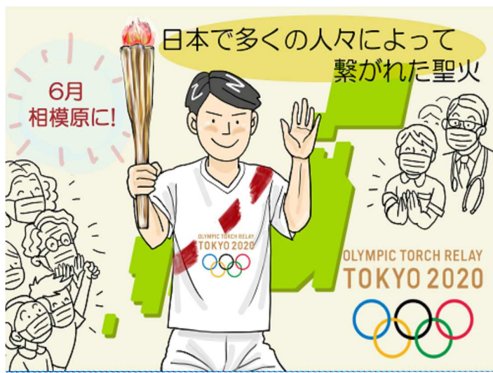
つばやきコマ「聖火ルー！」作:マチ ヨシコ

…とうまういくことばかりではない。千切りがみじん切りになったり、調味料を間違えたりする有り様。それでも発足10年で開催100回を重ね、作ったメニューは354！好きなメニューを自宅で作って、家人に喜ばれることに味を占め、認知症カフェで軽食提供を始めた。このところ、新型コロナの影響で中断していることが、残念無念！(か)