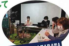
CINEMA Chupki TABATA

■ 視覚障がいの方のための音声ガイド、 聴覚障がいの方のための字幕をこれまでも協働してきた シネマ・チュプキ ※ さんとともに制作に取り組みました。 いつも思うのですが、音声ガイドと字幕をつくることで わたしたちは、より深く上映作品と出会えます。つくっていく過程のそのなかで このまちのひとつとともに映画鑑賞する思いも熱くなっていくのです。ぜひ、ごいっしょにと。 ※シネマ・チュプキ・タバタ=田端にある日本で唯一のユニバーサル映画館です。