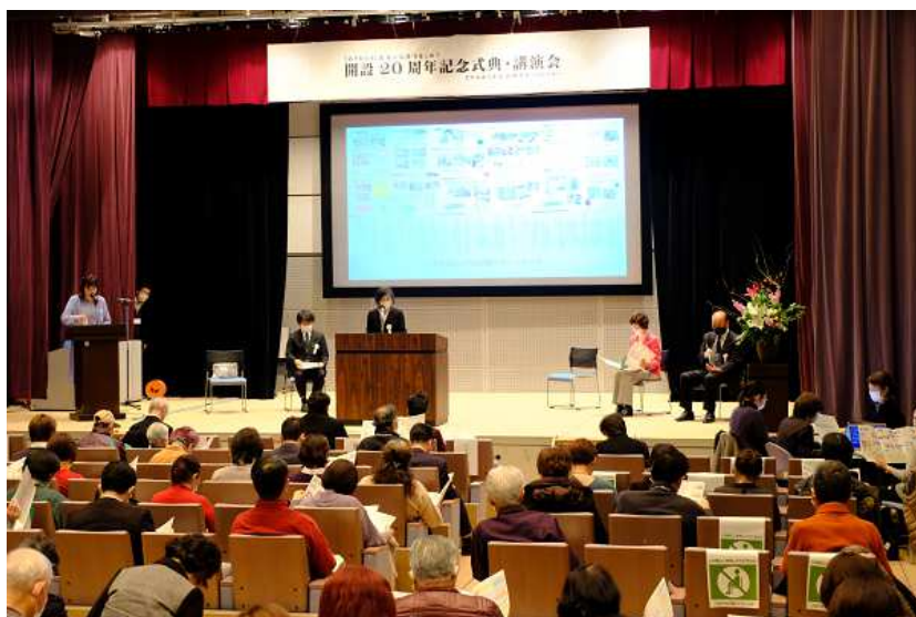
当日、たくさんの方が駆けつけてくれました！写真は20年の歩み説明中

2月にもかかわらず、春のように暖かい日曜日相模原市中央区の産業会館で開設20周年記念式典・講演会を開催しました。主催・来賓挨拶に続き、これまでの歩みを1枚のパンフレットにまとめ、簡潔に説明したのち、基調講演とシンポジウムを行いました。懐かしい方々、日ごろから良く利用される団体の方々とのお時間を共有することができました。