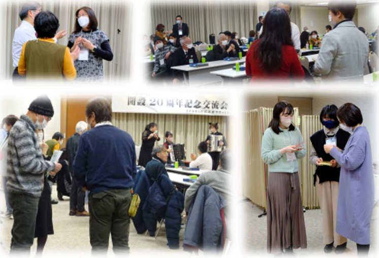
感染対策のさまざまな制約もある中、それでも盛んに交流がありました

講演会終了後、会場を変えて第2部の交流会を実施。ここ数年は飲食を伴う事業を見送ってきたため、3年ぶりに計画しました。感染症の心配が残っていたため、なるべく着座をお願いし一人ひとりにお弁当を用意することにしました。これにより、通年の交流会より名刺交換ができなかったり、お茶での乾杯になったりと、雰囲気が違った会になってしまいました。それでも、「知らない団体と挨拶できた」「講師の名刺をもらった」「久しぶりに会えた」など嬉しい声もお寄せいただきました。最後の片づけまでお手伝いくださった方々にも感謝申し上げます。ありがとうございました。