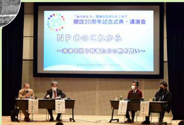
シンポジウムの様子