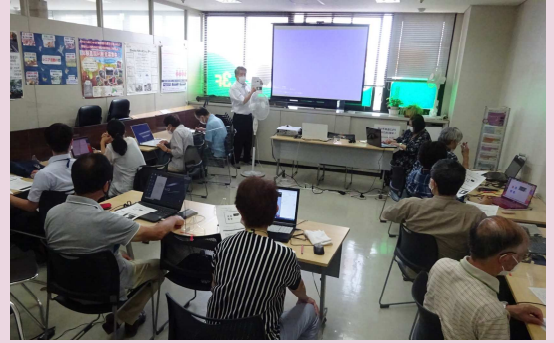
コロナ禍。オンライン（Zoom）のさまざまな活用方法を模索しました。写真は講座参加者のフォローアップ会の様子。