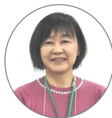
水澤チーフアドバイザー