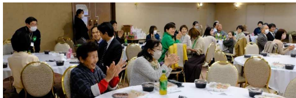
初対面の方とお話できるゲームには、景品も！