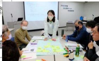
ワークショップの様子