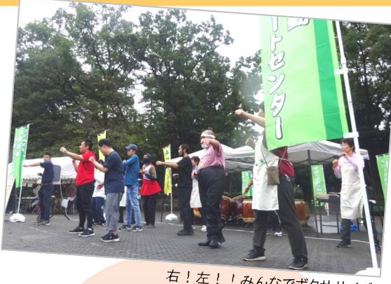
右！左！！みんなでボクササイズ