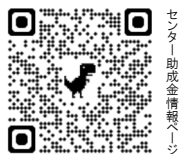
センター助成金情報へシ