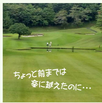
ちょっと前までは楽に越えたのに...

日本全国にゴルフ場は2,133ヶ所あり、そのうち神奈川県には42ヶ所。相模原市内では南区に1ヶ所、緑区に5ヶ所と意外に少ない気が…。ちなみに6ヶ所の中で5ヶ所体験済でいずれも素晴らしいゴルフ場でした。でも…池のあるホールは苦手だな！（い）