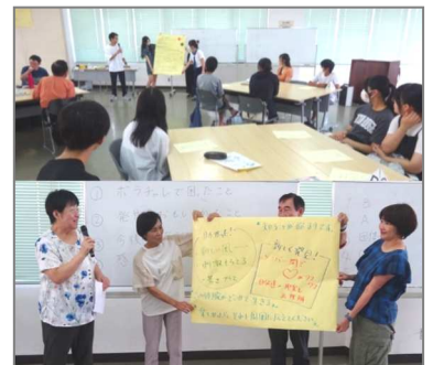
中高生ボランティアチャレンジスクール 8月25日まとめの会@相模ボラディア