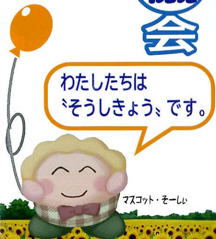
マスコット・ソーシ