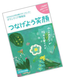
今年の表紙デザインは「Clay」さん