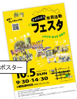
昨年度のポスター