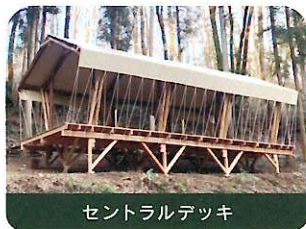
セントラルデッキ