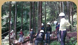
作業は安全第一にゆっくりと!