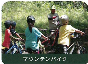
マウンテンバイク