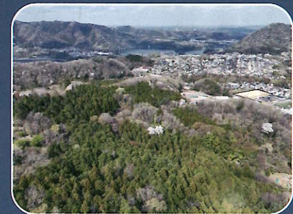
針葉樹と広葉樹のつちざわの森