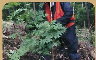
センダンのテスト育林